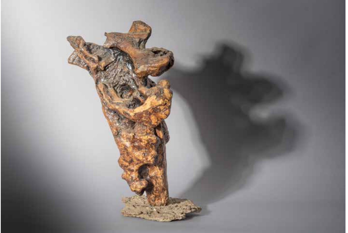
Les Chaos de Montpellier - 60 x 50 cm