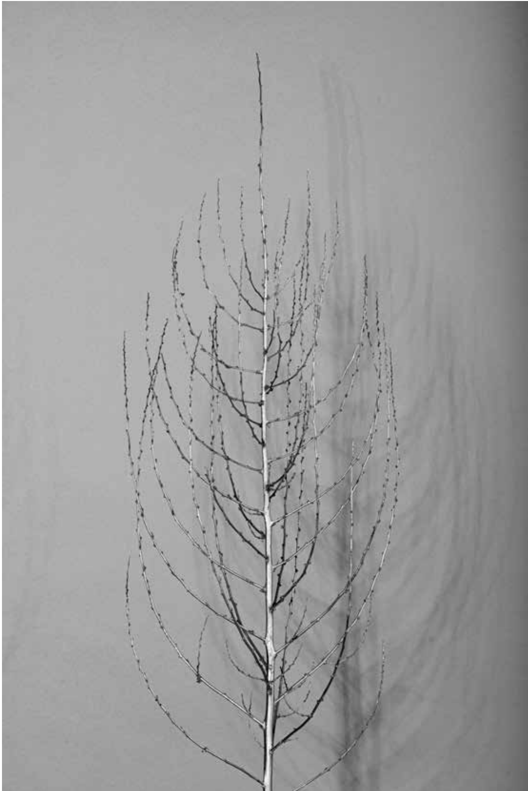
La molène séchée et ses arborescences - 40 x 100 cm

« Pour ce qui est de l'avenir, il ne s'agit pas de le prévoir, mais de le rendre possible »