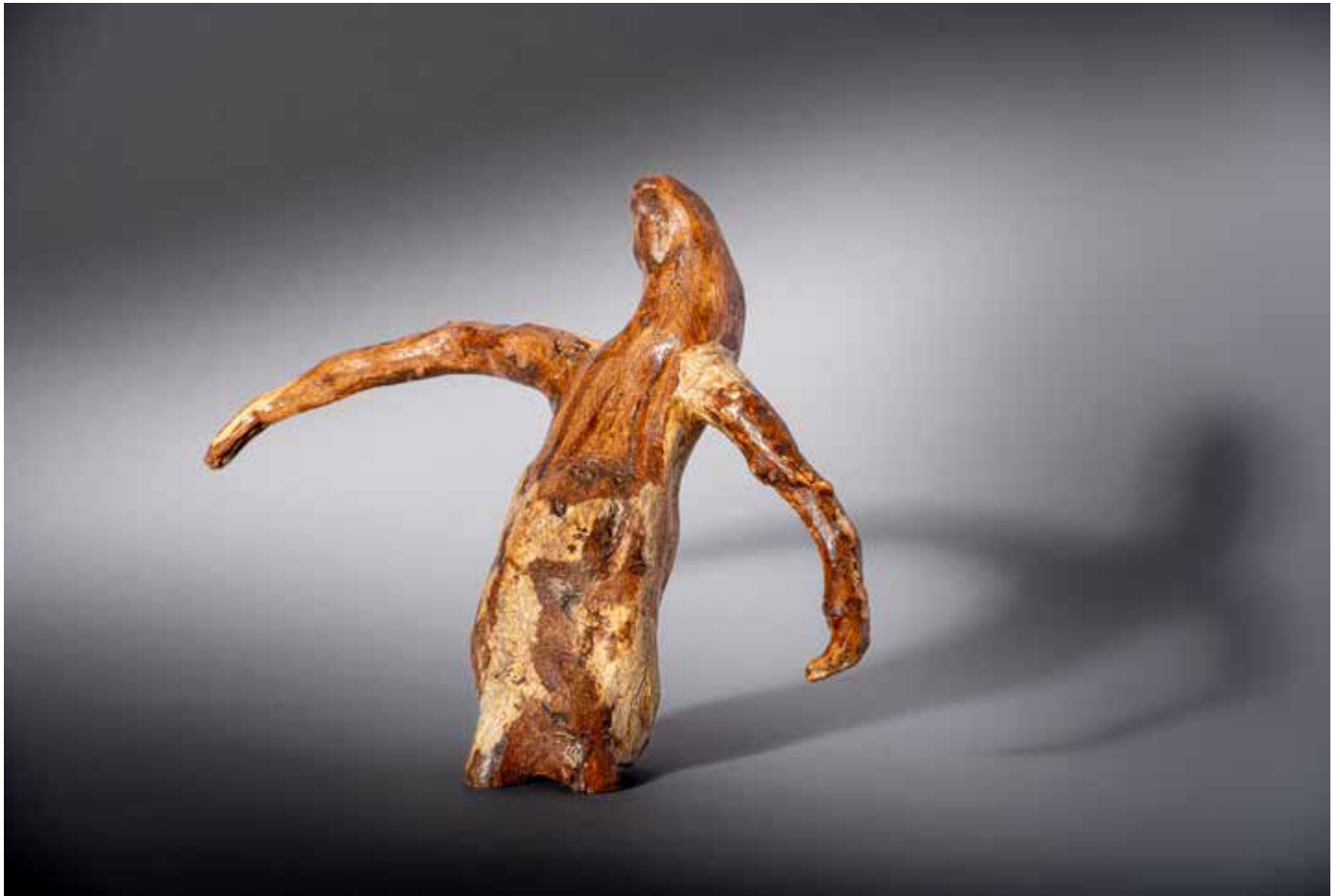
Le manchot - 30 x 30 cm