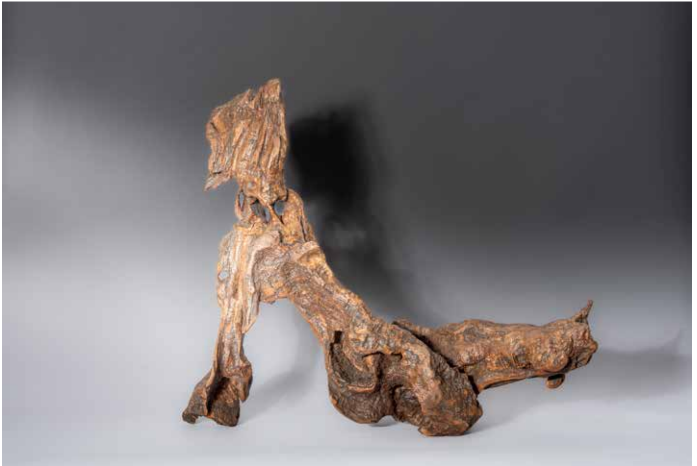
Les Chaos de Montpellier - 60 x 50 cm