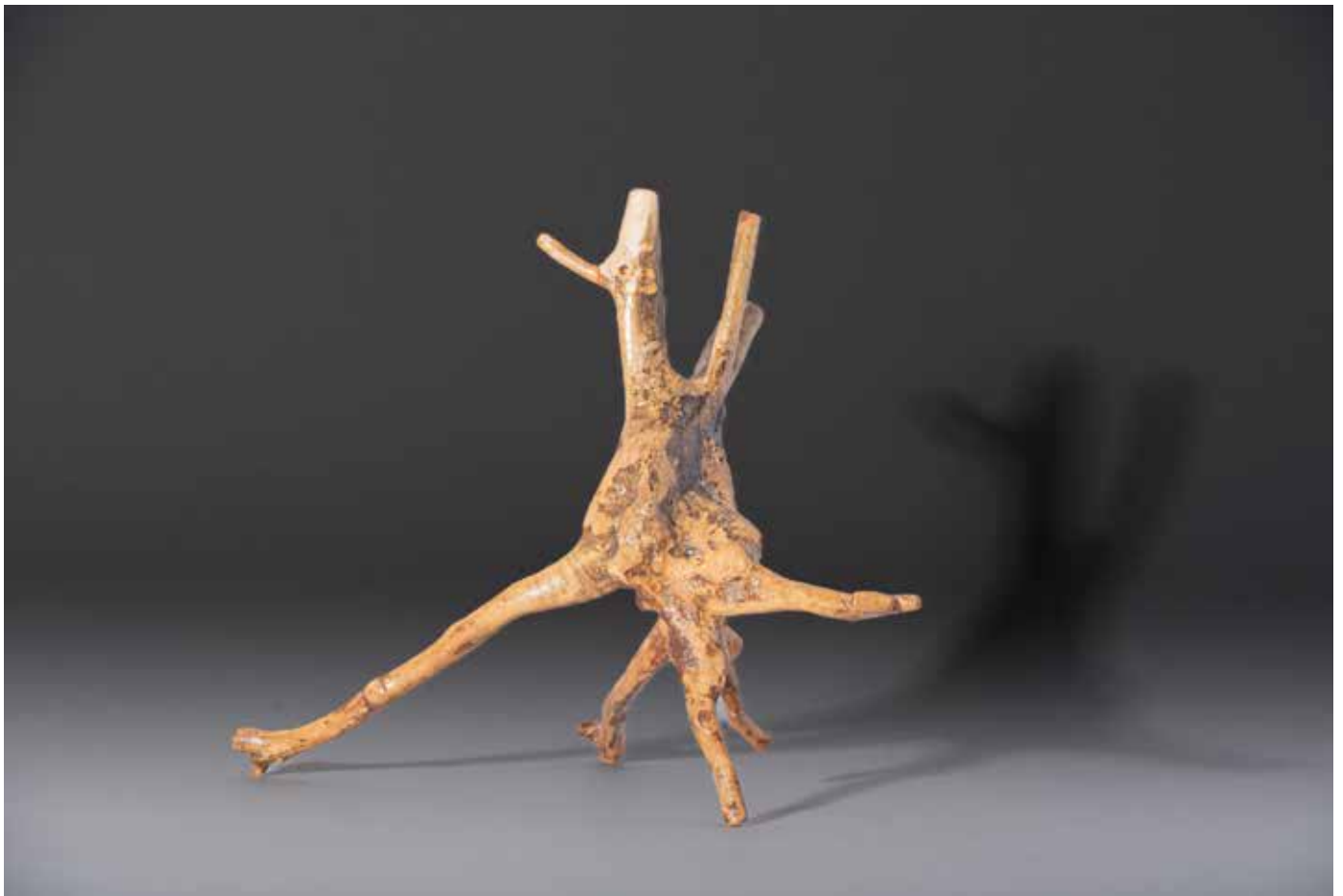
Dinosaure marin - 50 x 50 cm