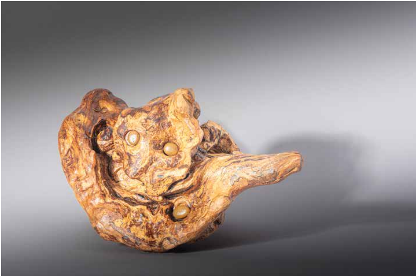
Argos ou Panoptes : celui qui voit tout avec cent yeux - 50 x 50 cm