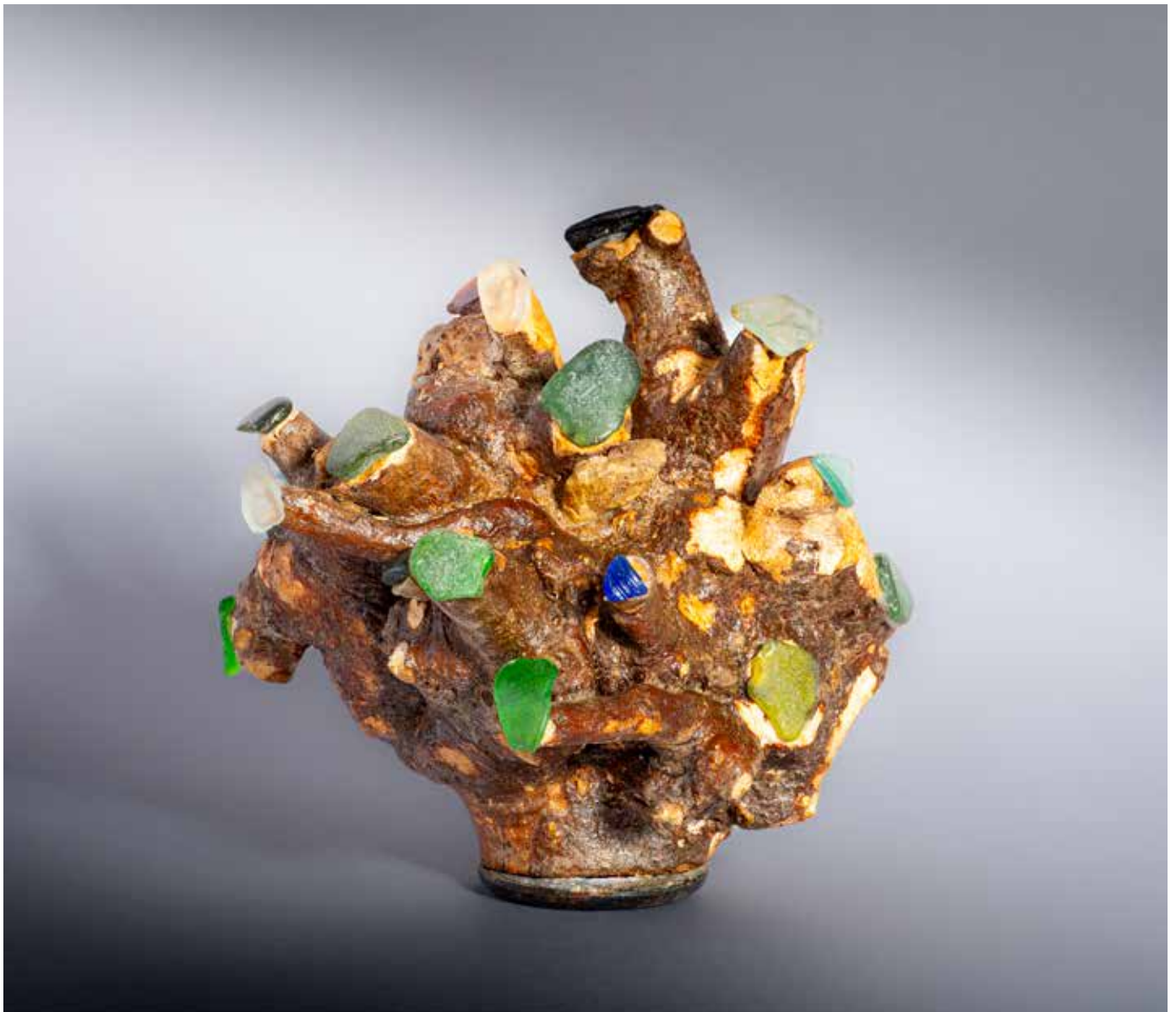
Le coronavirus ou l'astéroïde - 20 x 20 cm