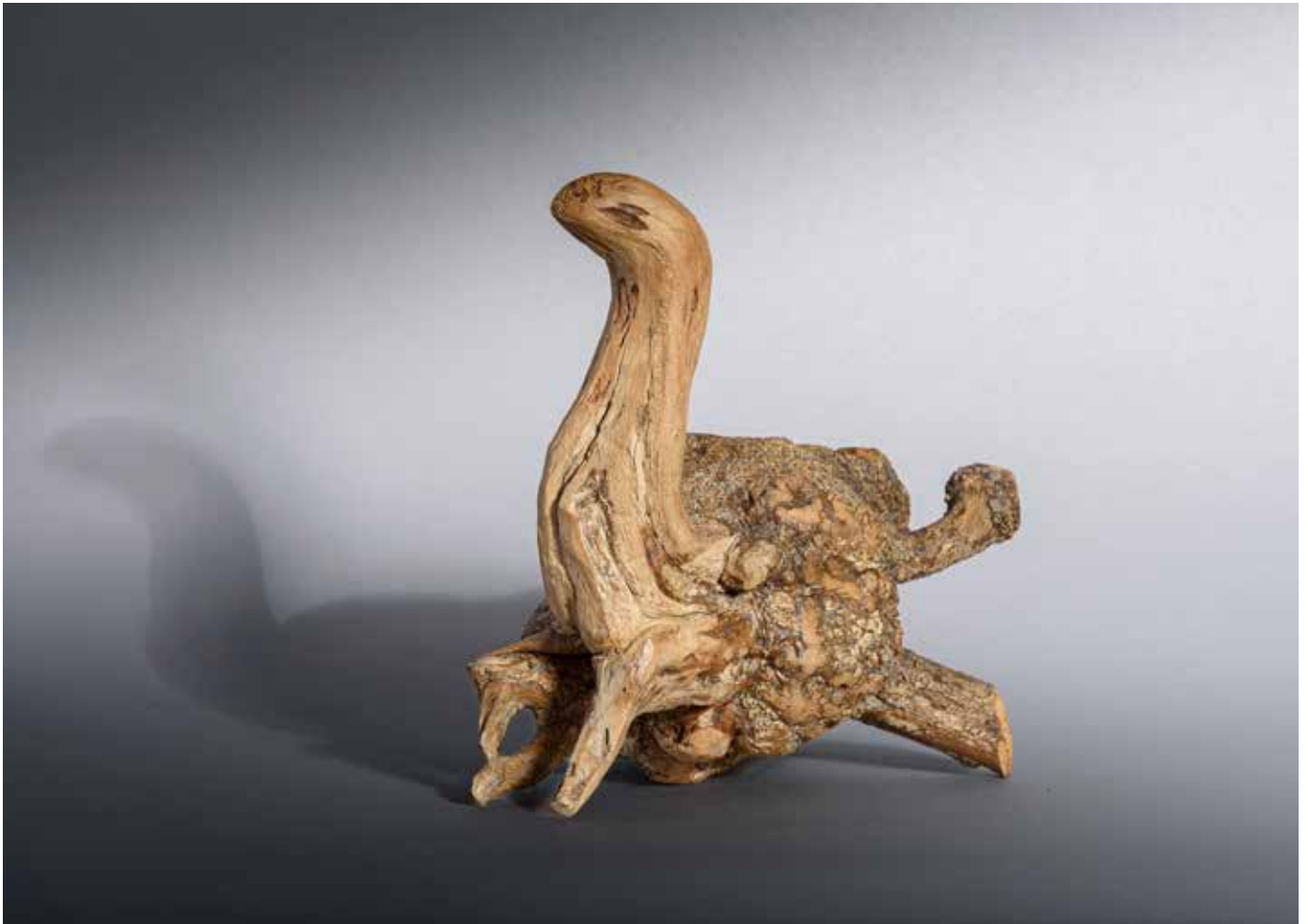
La tortue - 30 x 30 cm