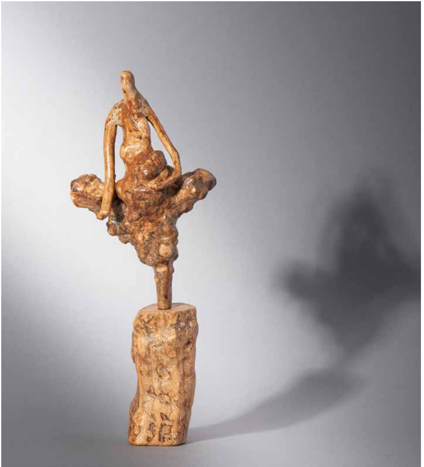
La vénus de Lespugue ou la joconde de la préhistoire - 20 x 20 cm