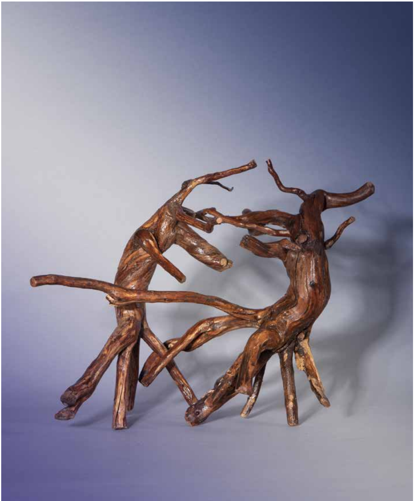
La danse des octopodes - 40 x 30 cm