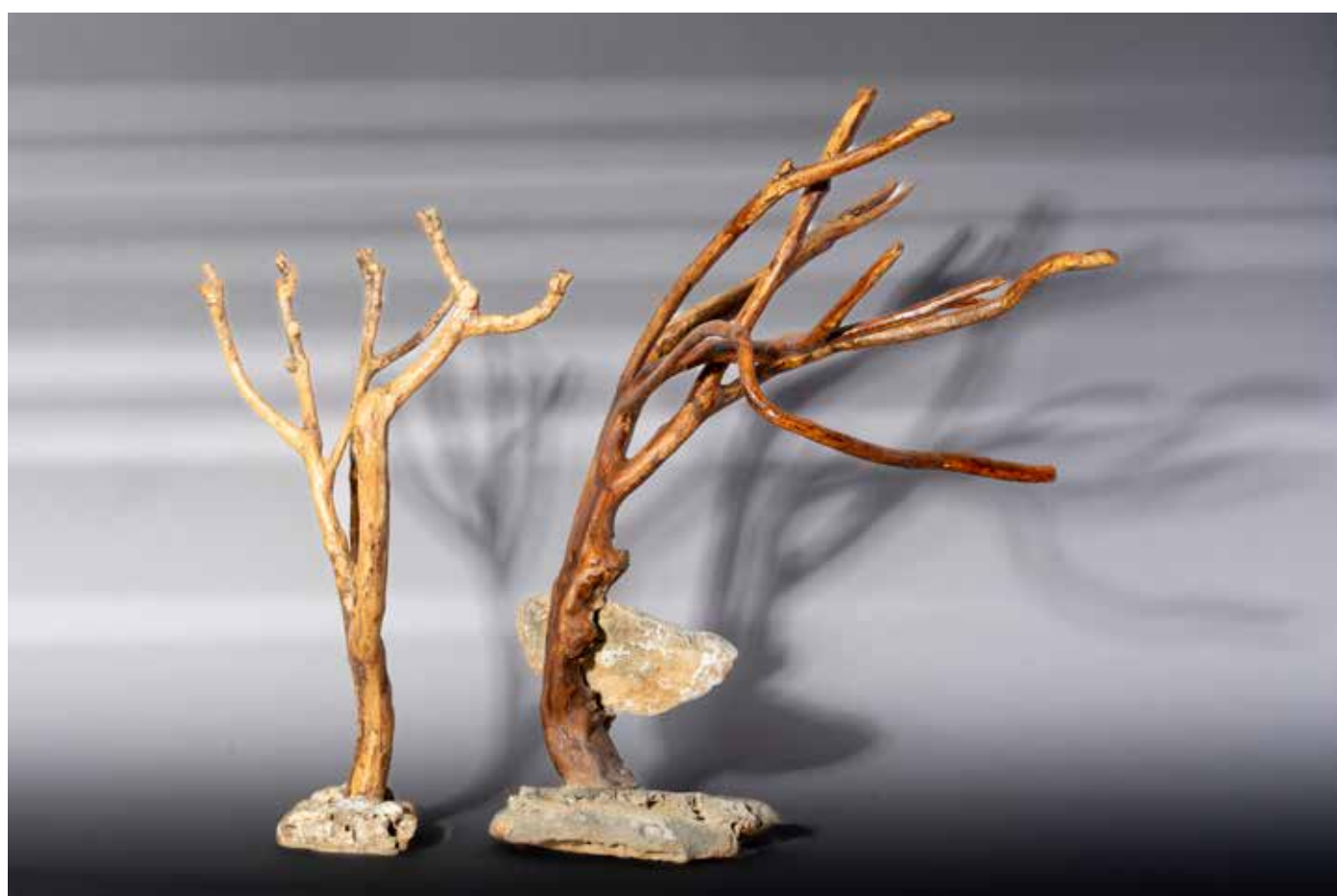
Miracle des lumières - Chandelier à sept branches et chandelier à neuf branches - 70 x 40 cm