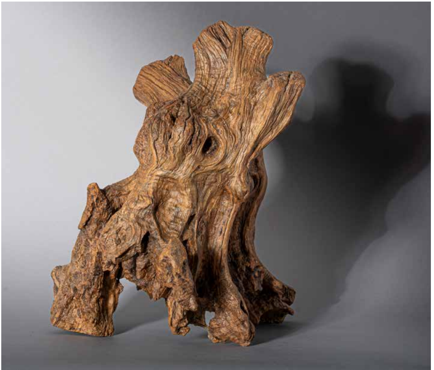
Le vieillard aux traits burinés - 50 x 50 cm