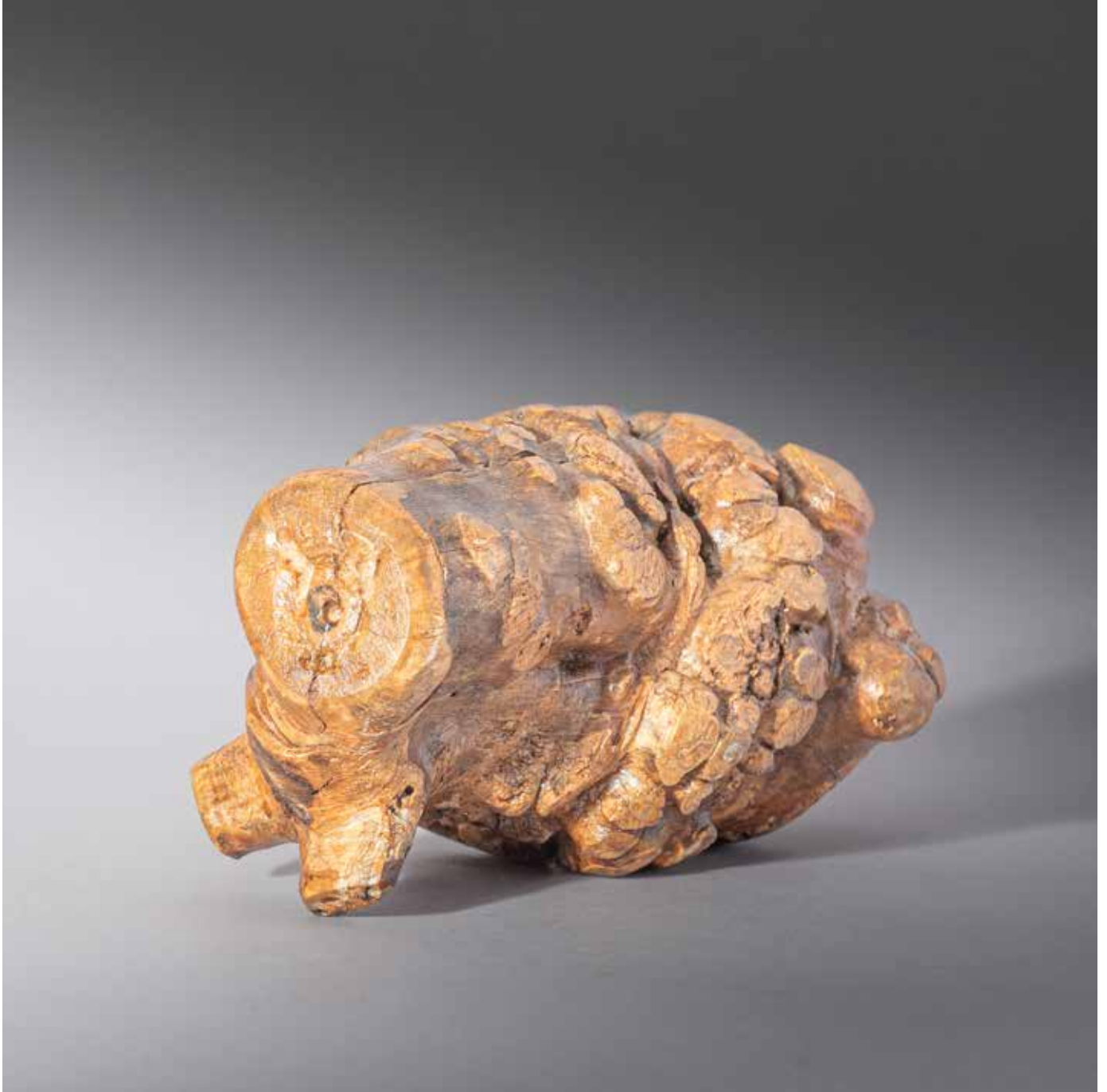
Le tardigrade - ourson d'eau, sont-ils vraiment immortels ? - 20 x 20 cm