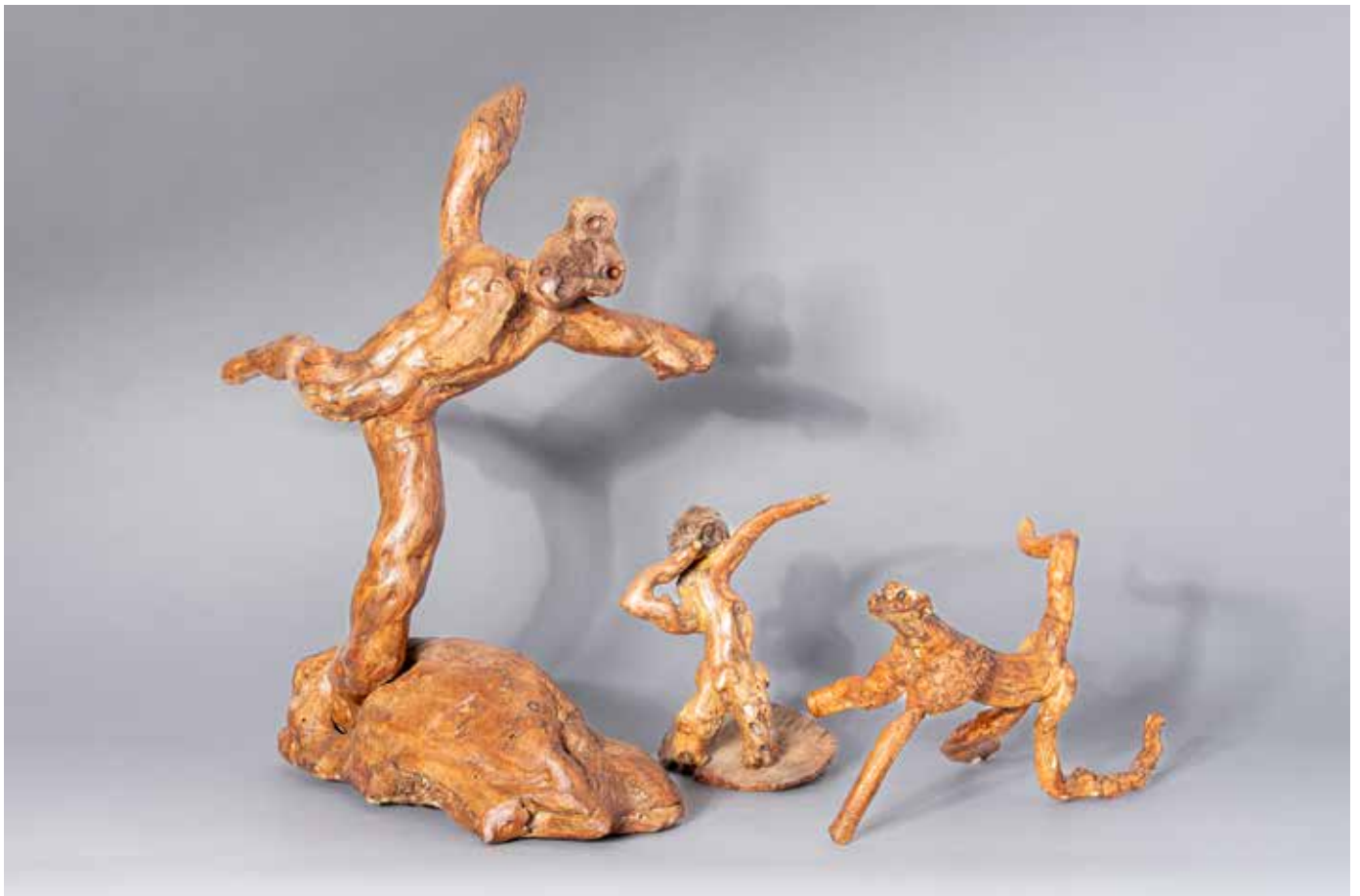
Les singes sportifs - 50 x 50 cm