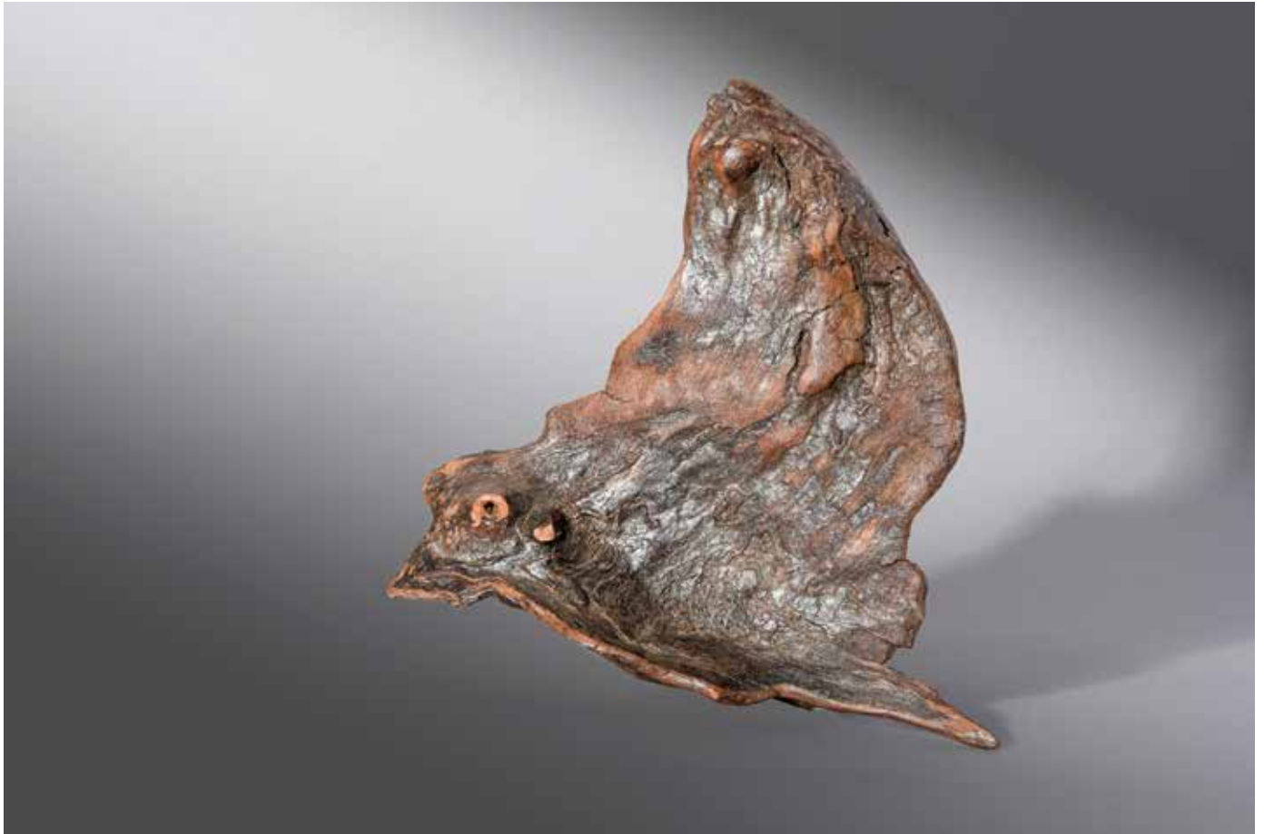
Icare ou L'envol du faucon pèlerin - 20 x 20 cm