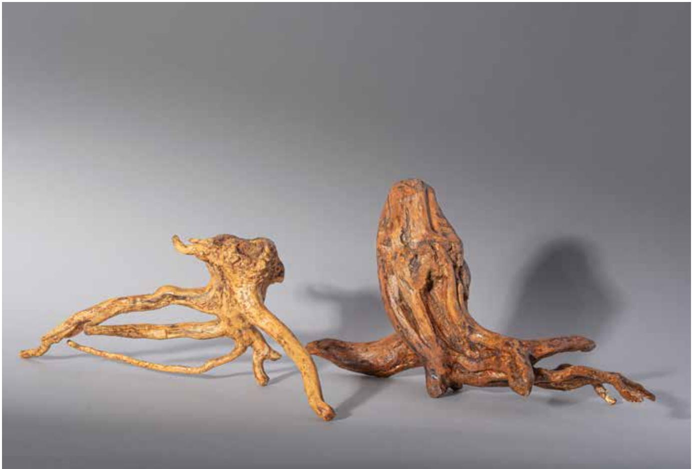
Les pieuvres - 60 x 50 cm