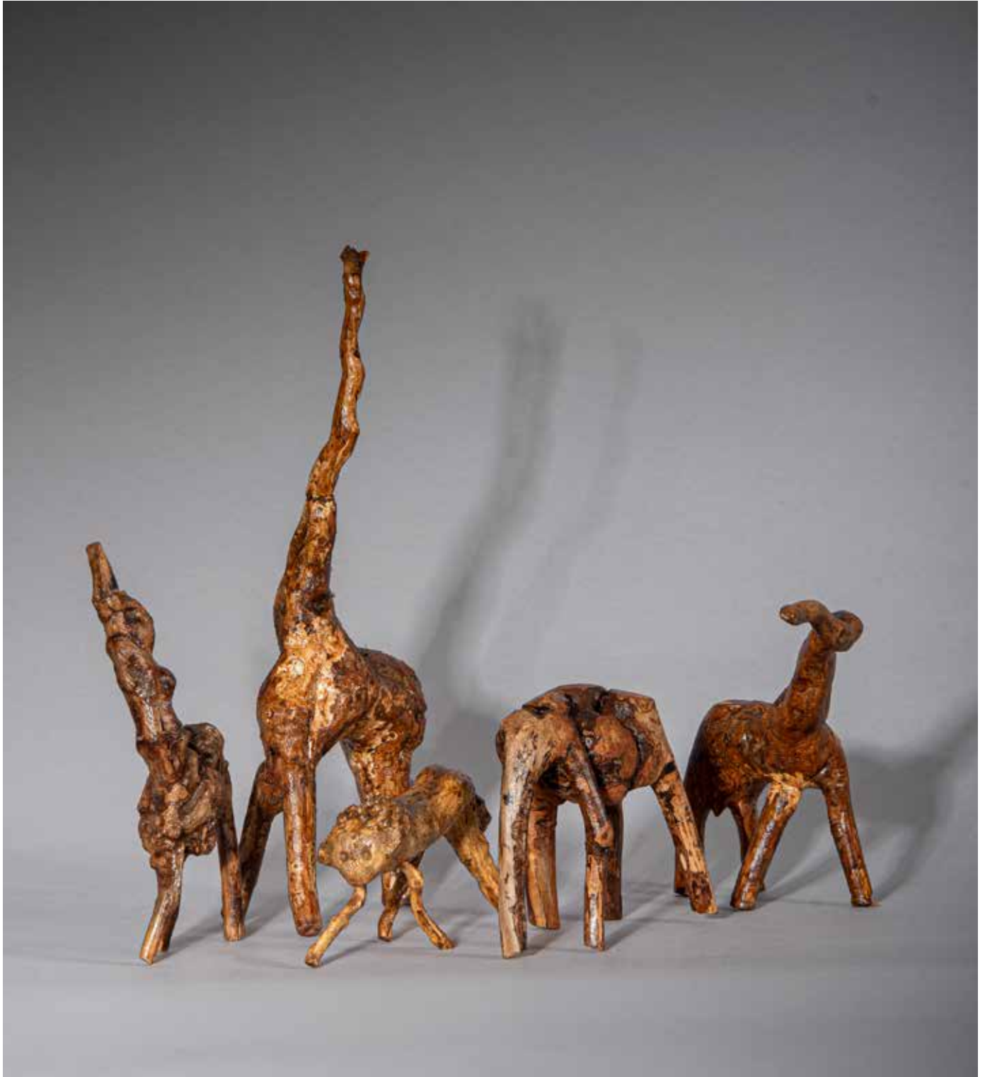
Le zoo - 40 x 30 cm