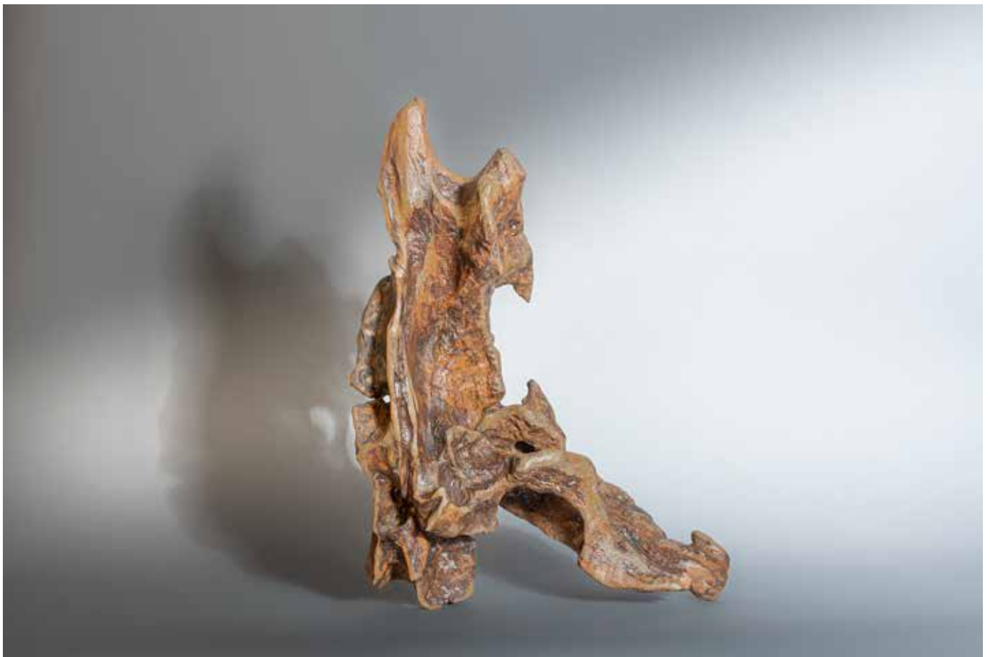
Les Chaos de Nîmes - 70 x 40 cm