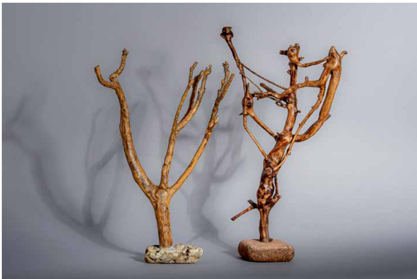
Miracle des lumières - Chandelier à sept branches - 60 x 40 cm