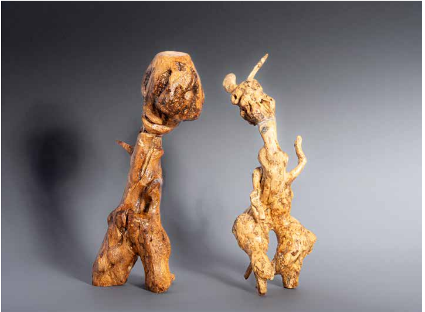
Les extraterrestres - 40 x 30 cm