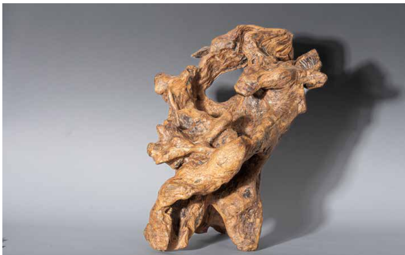
Les lutteurs - 60 x 50 cm