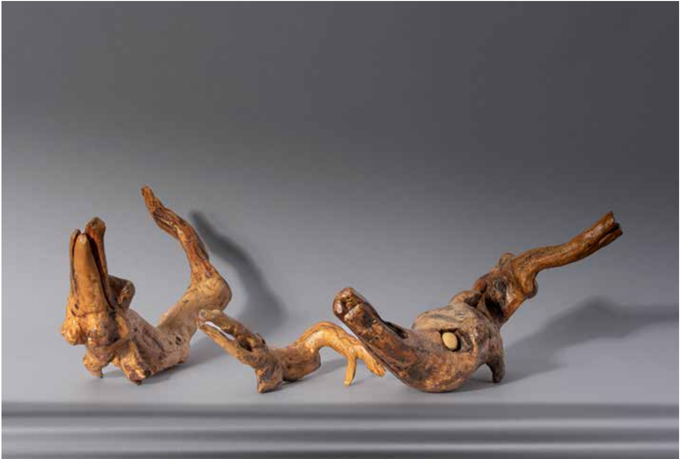
La famille des crocodylus - 30 x 50 cm