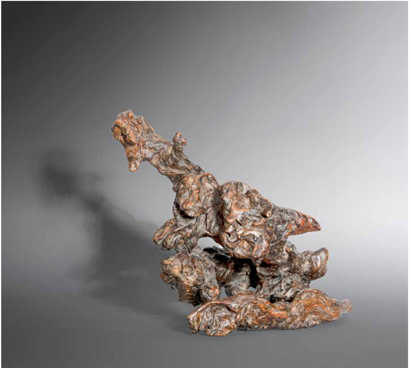
Le monstre des quinconces - 40 x 40 cm