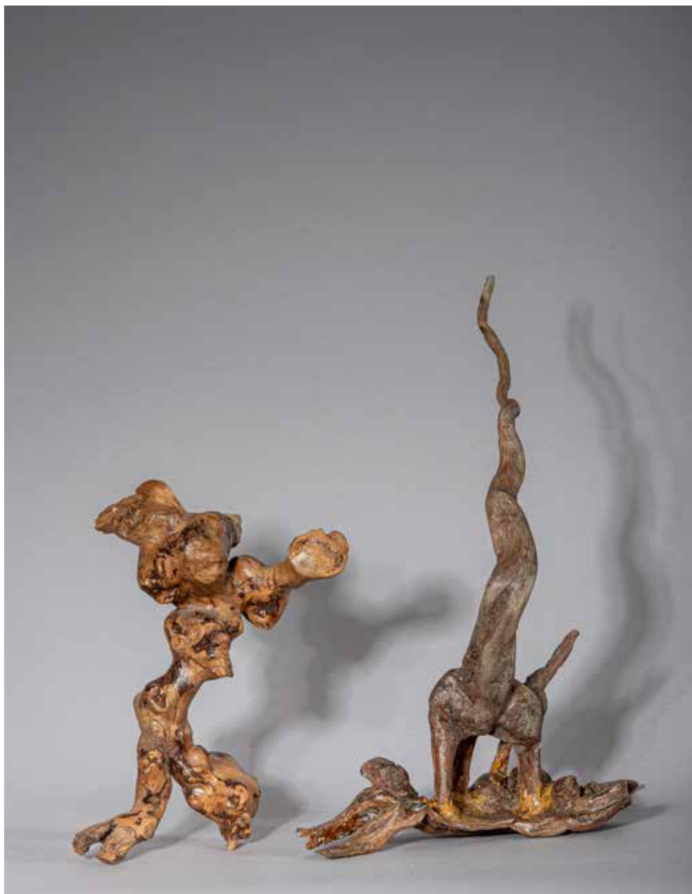
Pinocchio et l'enfant d'éléphant - 40 x 40 cm