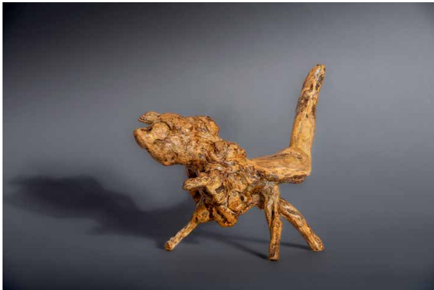
La bête du gévaudan - 20 x 20 cm