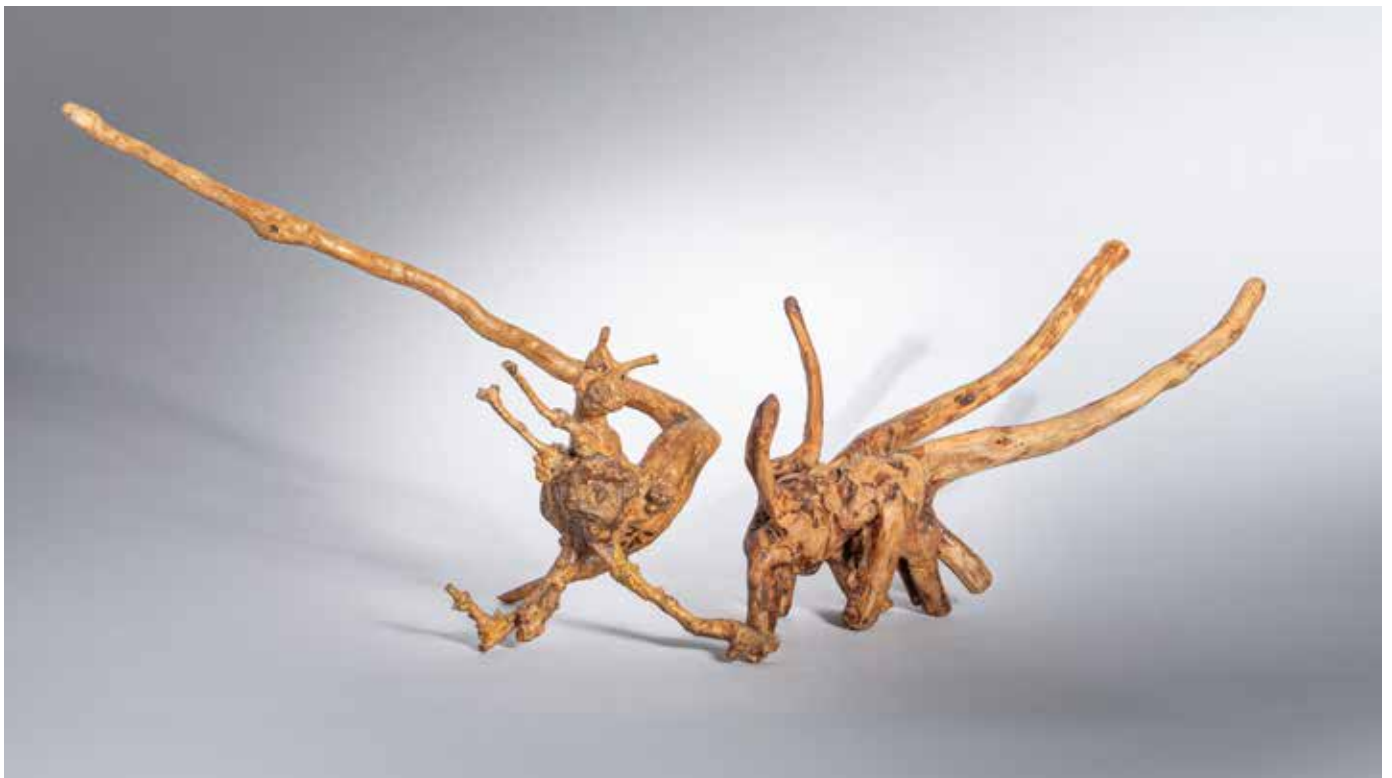
Le chat botté et le scarabée rhinocéros géant - 40 x 40 cm