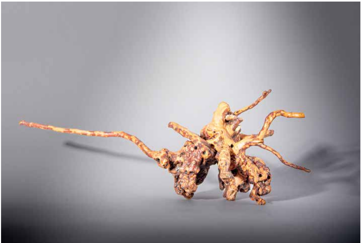
L'araignée loup - 30 x 70 cm