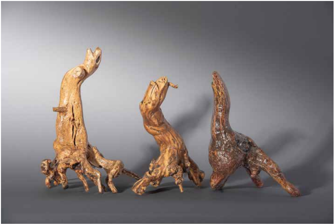
Phoques ou otaries - 40 x 30 cm