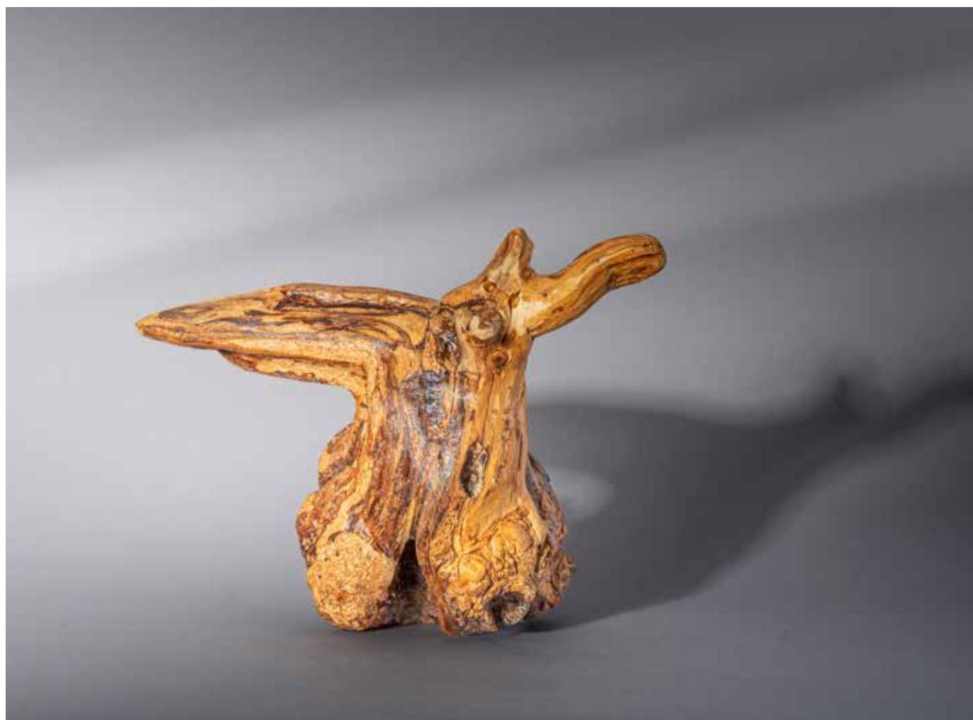
Le fantôme - 30 x 30 cm