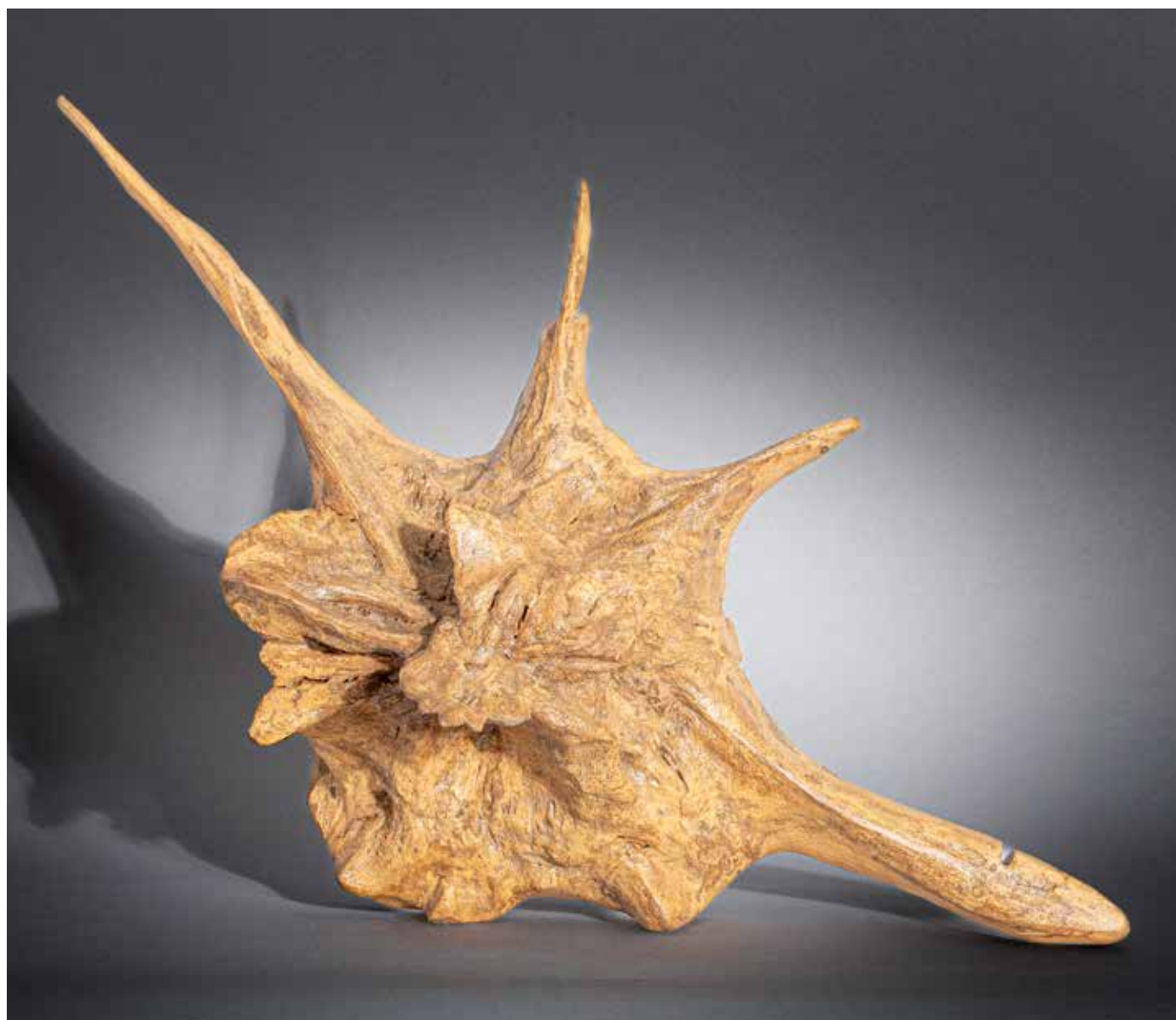
La tête du satyre - 50 x 90 cm