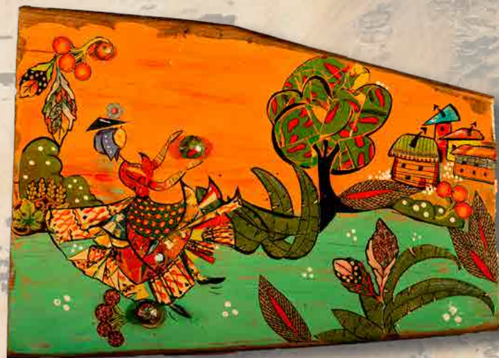
En route pour le village