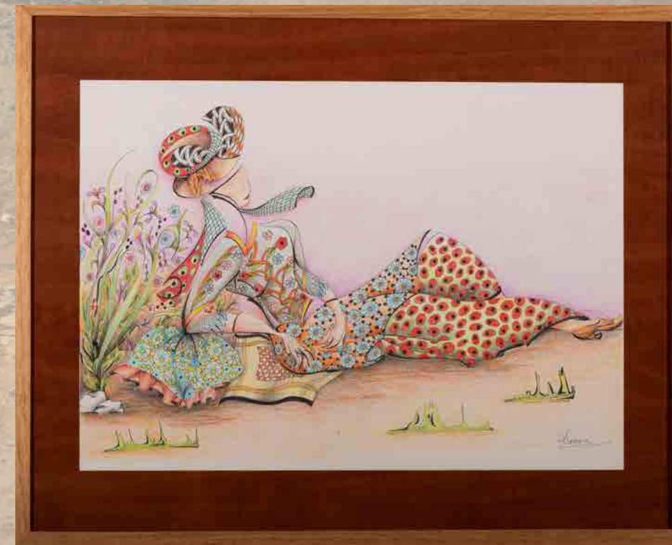
56 x 46 cm