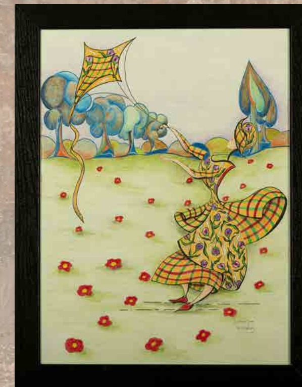
35 x 45 cm