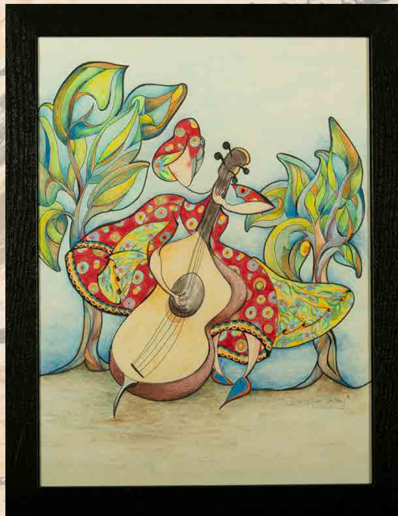
35 x 45 cm Feutres et crayons de couleur