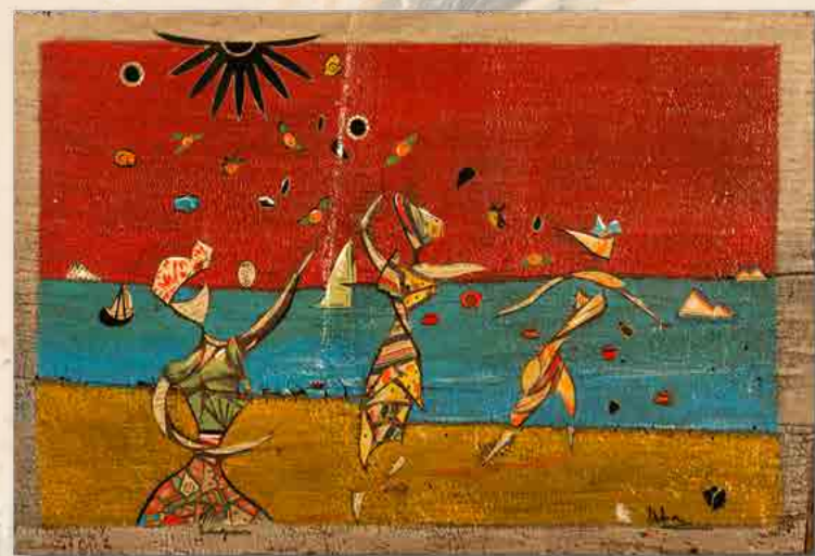
A la mer