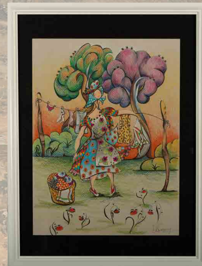
En étendant le linge